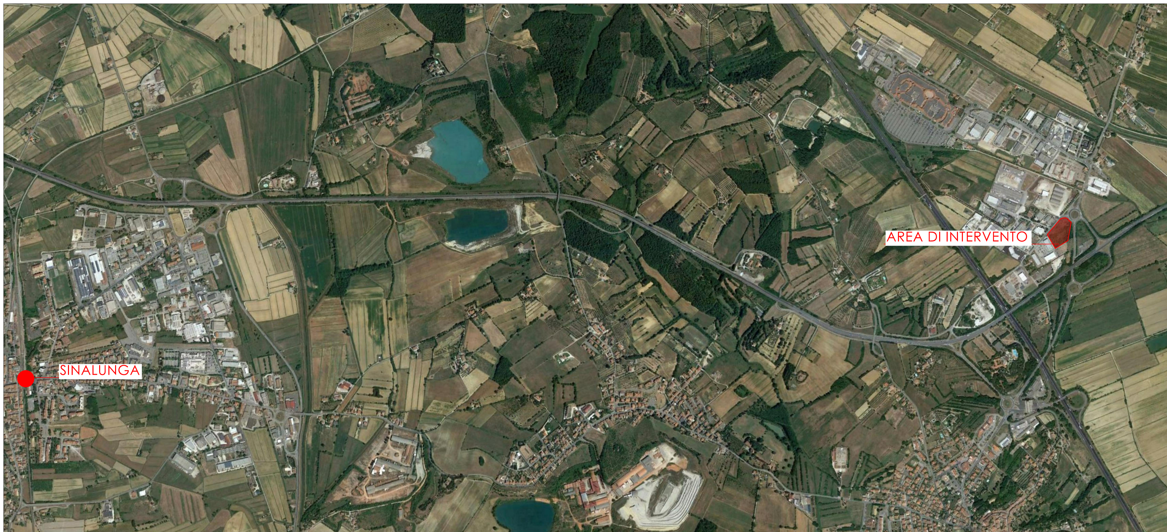
1 FOTO AEREA TAV 01 SCALA 1:10000