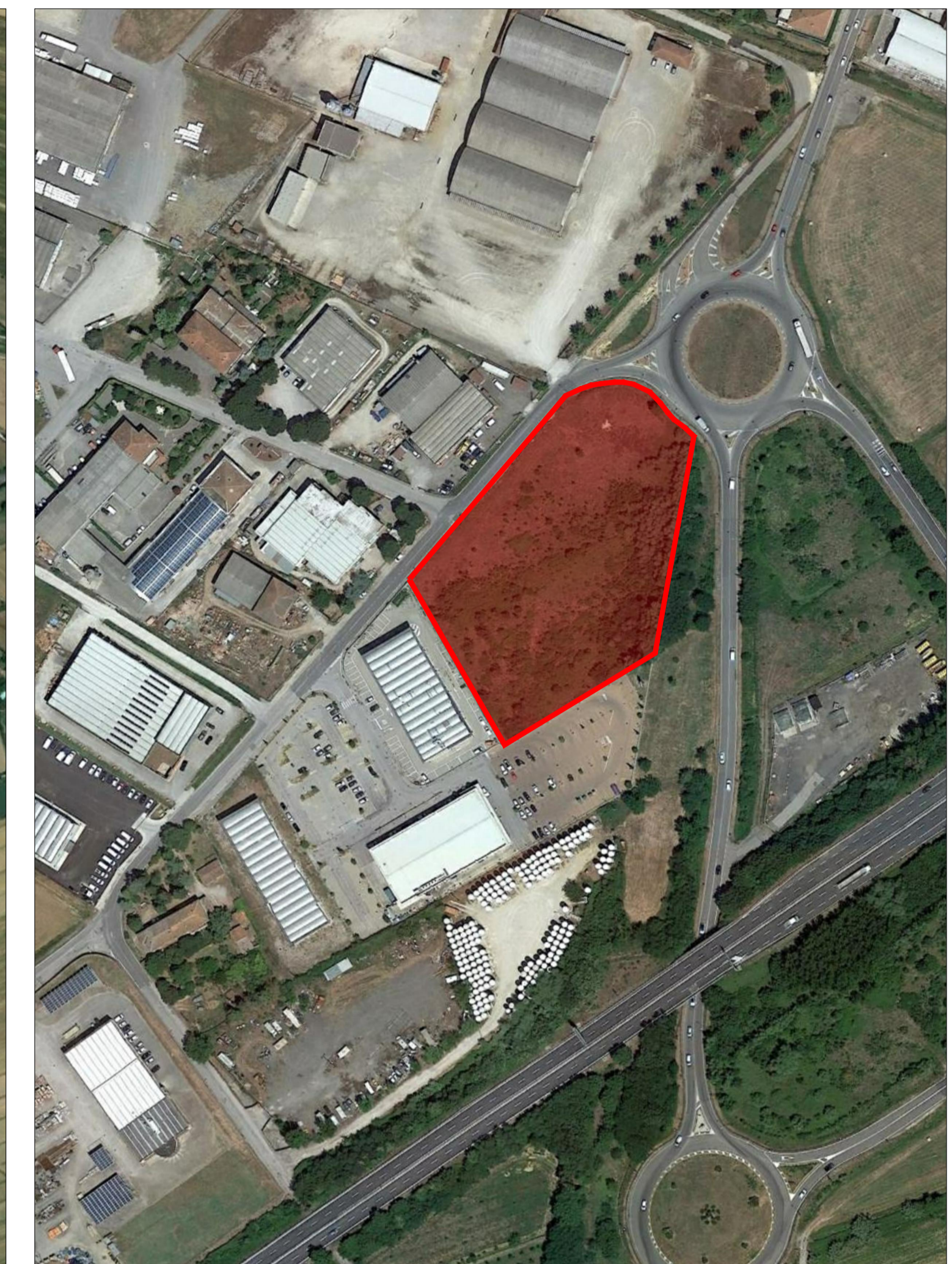
2 FOTO AEREA TAV 01 SCALA 1:2000