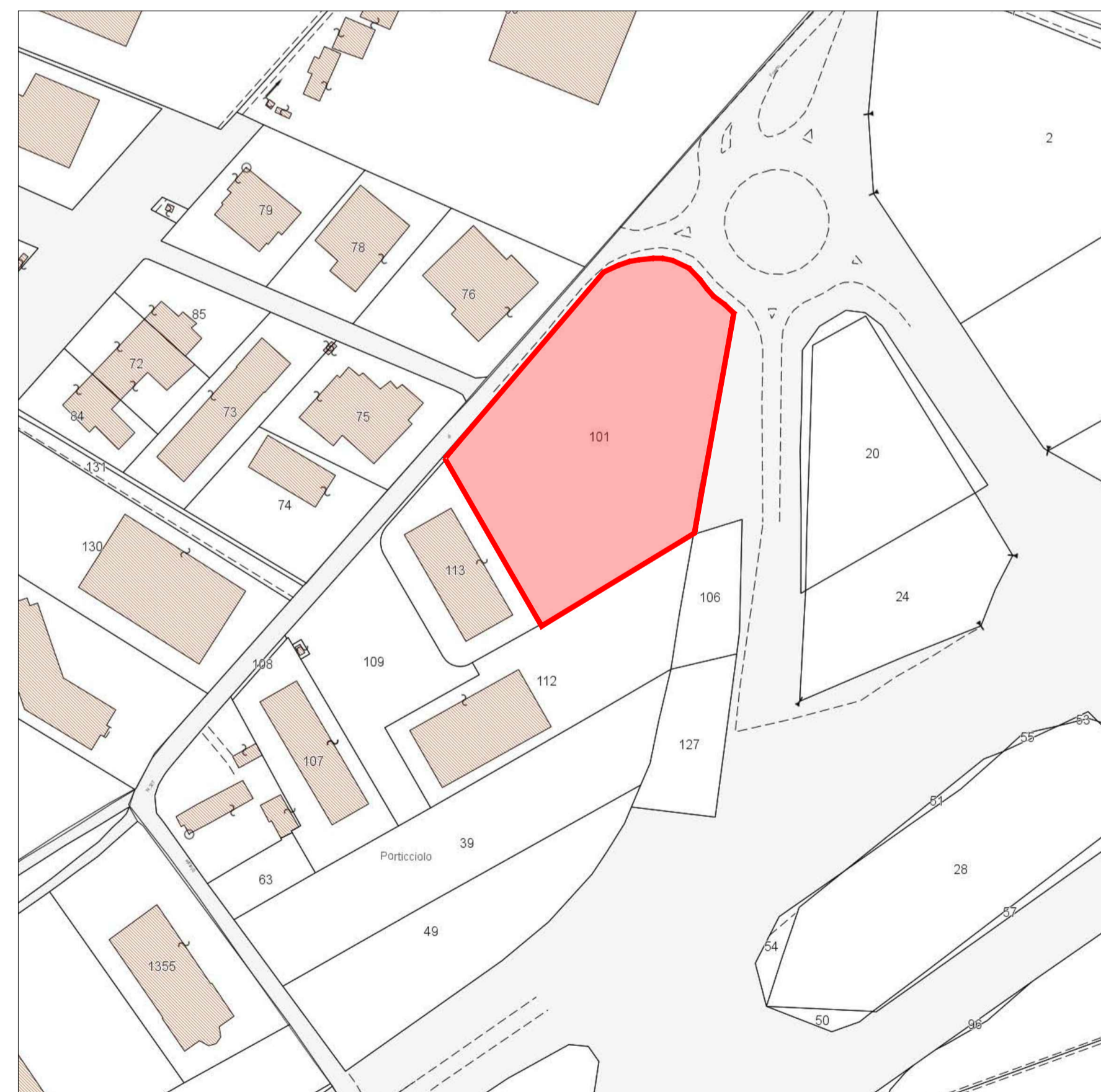
4 CATASTO TAV 01 SCALA 1:2000