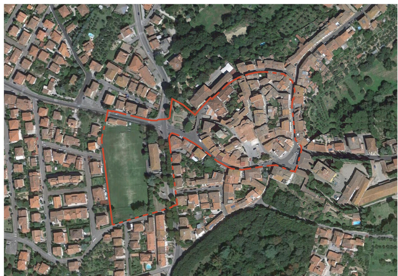
BETTOLLE: Ortofotocarta 1:2000